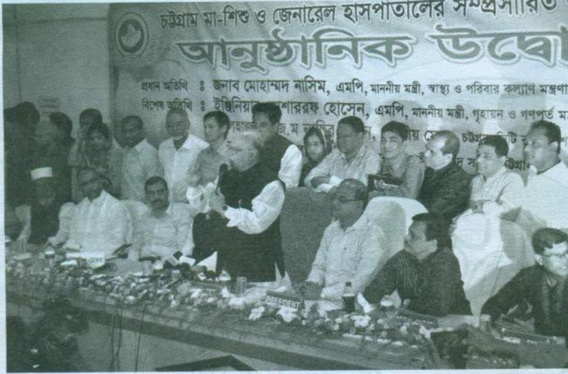
চট্টগ্রাম মা ও শিশু হাসপাতালের সম্প্রসারিত বহির্বিভাগ এর উদ্বোধনী অনুষ্ঠানে প্রধান অতিথির বক্তব্য রাখছেন গণপ্রজাতন্ত্রী বাংলাদেশ সরকারের মাননীয় স্বাস্থ্য ও পরিবার কল্যাণ মন্ত্রী জনাব মোহাম্মদ নাসিম।

চট্টগ্রাম মা ও শিশু হাসপাতালের সম্প্রসারিত বহির্বিভাগ গত ১৭/০৮/২০১৫ইং তারিখ আনুষ্ঠানিকভাবে উদ্বোধন করা হয়। গণপ্রজাতন্ত্রী বাংলাদেশ সরকারের মাননীয় স্বাস্থ্য ও পরিবার কল্যাণ মন্ত্রী জনাব মোহাম্মদ নাসিম, এম.পি, প্রধান অতিথি হিসেবে উপস্থিত থেকে হাসপাতালের সম্প্রসারিত