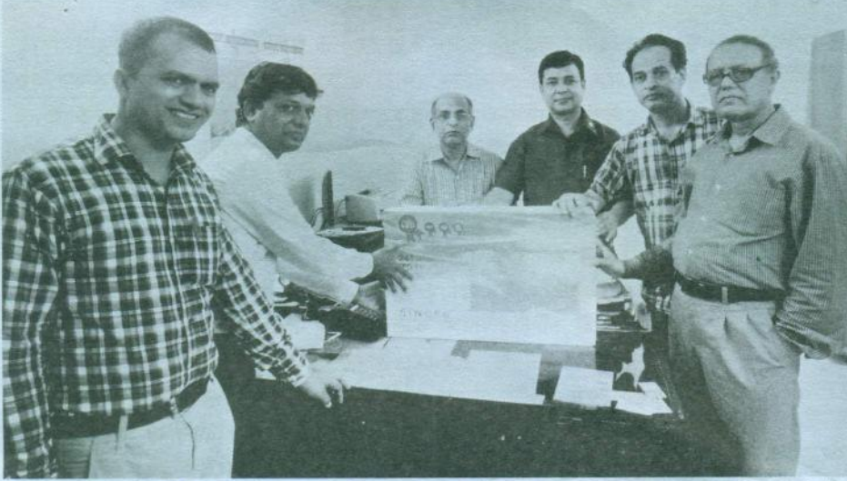
গ্রীনল্যান্ড ফার্মাসিউটিক্যালস লিঃ কোম্পানির পক্ষ থেকে চট্টগ্রাম মা ও শিশু হাসপাতাল কর্তৃপক্ষের নিকট আনুষ্ঠানিক ভাবে এলইডি টিভি হস্তান্তর করছেন।

ফার্মাসিউটিক্যালস লিঃ কোম্পানীকে হাসপাতালের জন্য টেলিভিশন প্রদান করায় আন্তরিক ধন্যবাদ জানান।